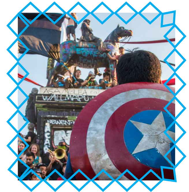
LXS JÓVENES RADICALIZADXS DE HOY (Y SU IMPULSO AL ESTALLIDO)

Desde el 2006 hasta ahora la gran discusión era: o caes en las máquinas representacionales, institucionales o continuas en la radicalidad, desde afuera de los espacios formales de la política. Y estas dos fuerzas estaban en